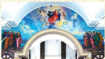
55 അടി നീളവും 20 അടി വീതിയുമുള്ള സ്വർഗ്ഗാരോഹിത മാതാവിന്റെ മൂറൽ പെയിന്റിംഗ്