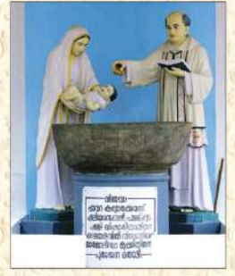
വി. ചാവറ കുര്യാക്കോസ് ഏലിയാസച്ചൻ ഇവിടെ വികാരിയായിരുന്നപ്പോൾ ഉപയോഗിച്ചിരുന്ന ഒറ്റക്കല്ലിൽ തീർത്ത മാർഗ്ഗസതട്ടി ഇപ്പോഴും ഇവിടെ സൂക്ഷിച്ചിരിക്കുന്നു.