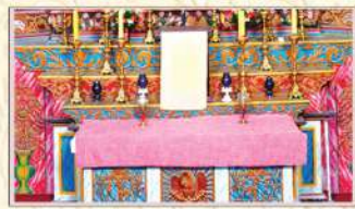
വി. ചാവറയച്ചൻ ബലിയർപ്പിച്ചിരുന്ന ബലിപ്പീഠം പ്രധാന അർത്ഥത്തിൽ സൂക്ഷിച്ചിരിക്കുന്നു.