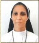
സി. ജോയിന്ത FCC ആനിയോൾ