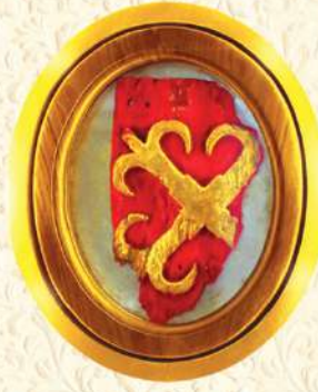
മാർ തോമാശ്ലീഹി കോക്കമംഗലത്ത് സ്ഥാപിച്ച കുരിശ്, വേമ്പനാട്ട് കായലിലൂടെ ഒഴുകി മാട്ടേൽ ദ്വീപിൽ അടിയുകയും അത് അത്ഭുതകരമായി കണ്ടെത്തിയപ്പോൾ കൊണ്ടുവന്ന പള്ളിപ്പുറം പള്ളിയിൽ സ്ഥാപിക്കുകയും ചെയ്തു.