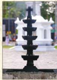
നാനാഭാതി മതസ്ഥർ എണ്ണയൊഴിച്ചു കത്തിക്കുന്ന കരിമ്പിള്ളി