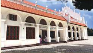
വി. ചാവറ പിതാവ് താമസിച്ച വൈദിക പരിഷ്കരണ നേടിയ സെമിനാരി