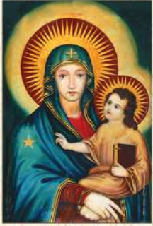
വി. ലൂക്കാ സുവിശേഷകൻ വരച്ചെടുത്ത വിശ്വസിക്കപ്പെടുന്ന പരി. വൈഭവാന്മാരിന്റെ ചിത്രത്തിന്റെ പകർപ്പാണ് ഇവിടുത്തെ പ്രധാന അർത്ഥത്തിൽ പ്രതിഷ്ഠിച്ചിരിക്കുന്നത്.