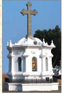
വിവിധ സ്ഥലങ്ങളിൽ പ്രത്യക്ഷപ്പെട്ട പരി. മാതാവിന്റെ വിവിധ രൂപങ്ങൾ പള്ളിയുടെ മുൻഭാഗത്തായി സ്ഥിതിചെയ്യുന്നു.