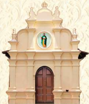
മാർതോമാ കുരിശ് പൊതുവണക്കണിനായി ആദ്യം പ്രതിഷ്ഠിക്കപ്പെട്ട കുരിശുപുരപ്പള്ളി