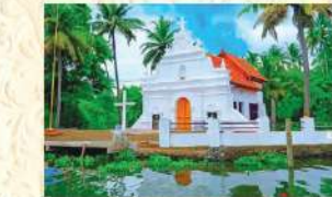
വി. കുരിശ് കണ്ടെടുത്ത സ്ഥലത്ത് സ്ഥാപിച്ച ദേവാലയം