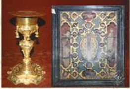
16-ാം നൂറ്റാണ്ടിൽ പള്ളിയിൽ സേവനമനുഷ്ഠിച്ചിരുന്ന ബി.ഷപ്പ് റഫായേൽ ഫിതരൈദോ സൽഭാഗോ ഉപയോഗിച്ചിരുന്ന കാനയും 33 വിശുദ്ധരുടെ തിരുശേഷിപ്പുണ്ടുന്ന പേടകവും